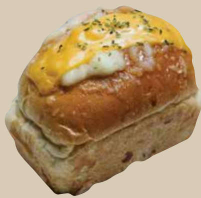
Baso Ayam Keju