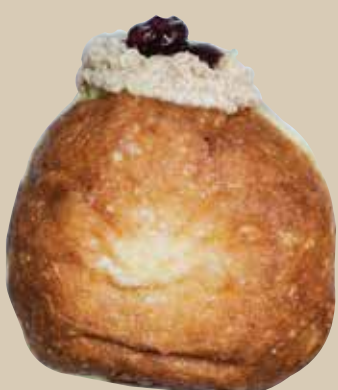
Peanut Butter & Jelly