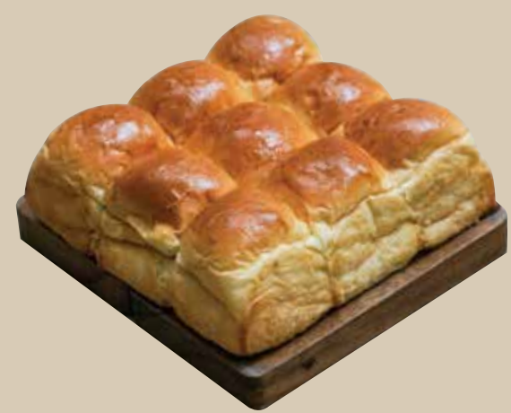
Roti Kalyan Klasik Sliders